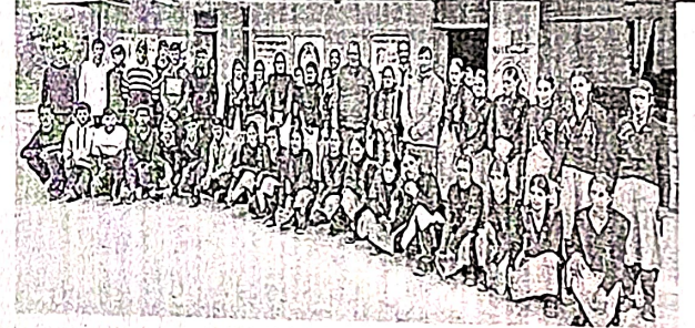
राजकीय महाविद्यालय टिकरू में आयोजित कार्यक्रम में प्रमुख वरिष्ठ व स्टाफ

उन्होंने बताया कि स्कूलों में कार्यक्रम कर बच्चों को जागरूक करने के लिए सभी तरह की तैयारियां पूरी कर ली गई हैं।